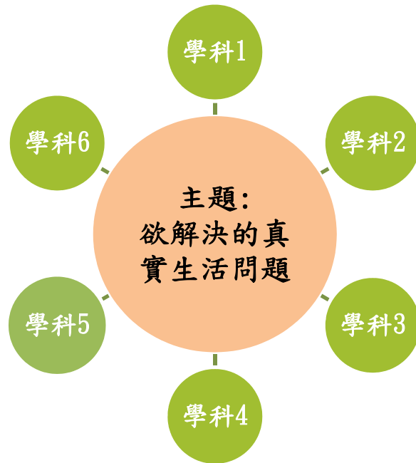
表一、主題跨域課程之課綱關聯圖